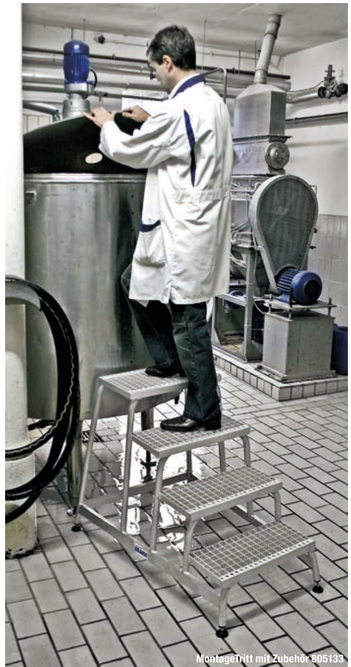
MontageTritt mit Zubehör 805133