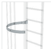
Abb. Bestell-Nr. 61237