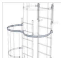
Abb. Bestell-Nr. 61963