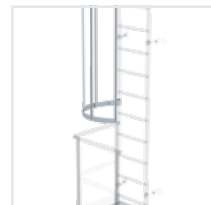
Abb. Bestell-Nr. 61277