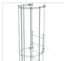
Abb. Bestell-Nr. 61235