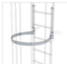
Abb. Bestell-Nr. 61234