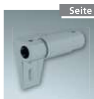
Endanschlag links Nr. 4998204