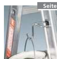
Eimerhaken Nr. 4990008