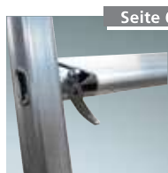
Aufsetzstufe Nr. 4990032