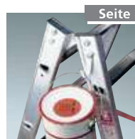
Eimerhaken Nr. 4990007