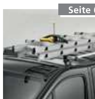
Leitersicherung (1 Paar) Nr. 4990019