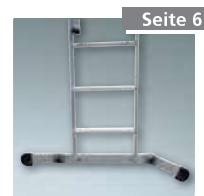
Vario-Traverse Nr. 4994126