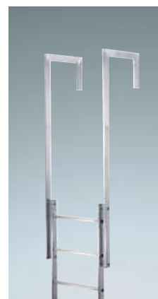
Ausstiegsholm 4) Einseitig, abgewinkelt