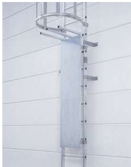
Stahl-Abschlussstür 1) Am oberen Ende Durchstiegsperre, Vorhängeschloss bauseits ArtikelNr. 9663498