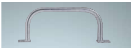
Haltegriff Mit Anschraubplatten

Stahl verzinkt, 400 mm ArtikelNr. 9667216