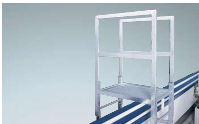
Attika-Überstieg Mit Gitterrost, Stahl verzinkt, Abstiegsleiter 1220 mm lang, Ablängung bauseitig. Für den Abschluss am Abstieg empfehlen wir verstellbare Wandanker oder Fußplatten.