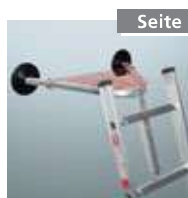
Seite 59 Wandabstandhalter Nr. 4991042