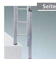
Seite 62 Holmverlängerung Nr. 4993401