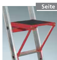
Seite 60 Einhängepodest Nr. 4991043