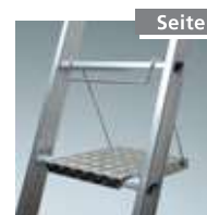
Gr. Werkzeugablage Nr. 4991041