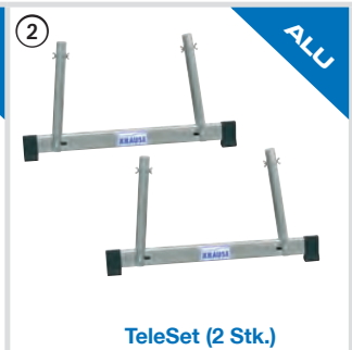
TeleSet (2 Stk.)