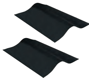
NonSlip (2 Stk.) im Lieferumfang enthalten