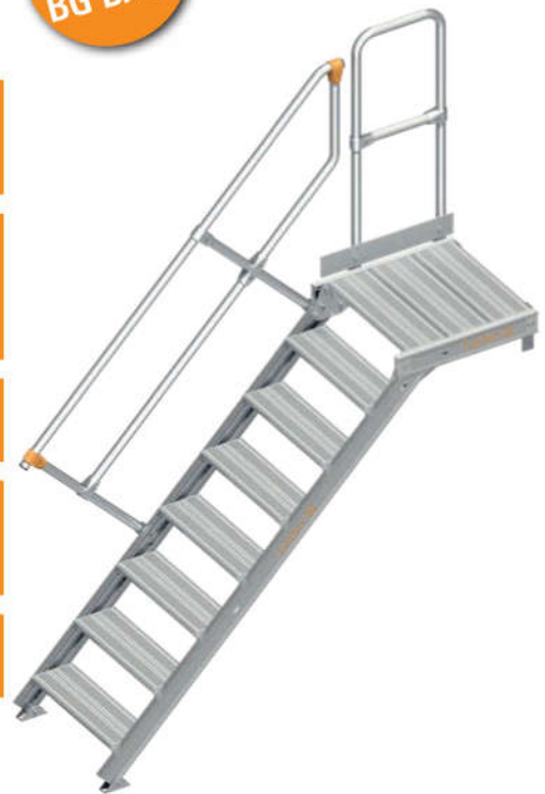
Abbildung entspricht dem Standard-Lieferumfang

R12 Aluminium geriffelte Stufen im Preis enthalten