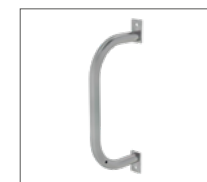
Abb. Bestell-Nr. 67216