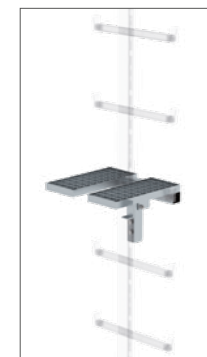
Abb. Bestell-Nr. 77539