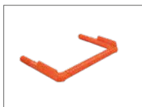
Abb. Bestell-Nr. 65173