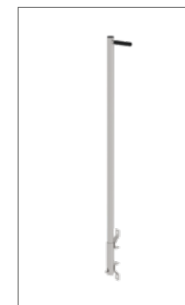
Abb. Bestell-Nr. 65003