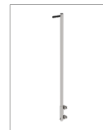
Abb. Bestell-Nr. 65004