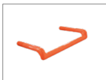
Abb. Bestell-Nr. 65171