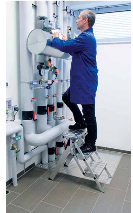
Abb. Bestell-Nr. 54203