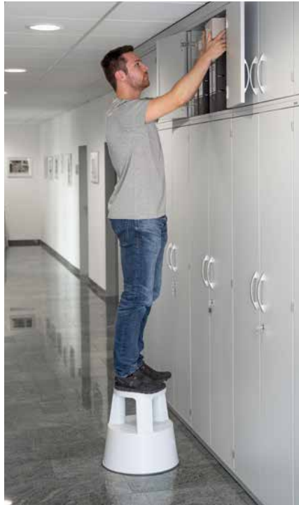
Abb. Bestell-Nr. 50001