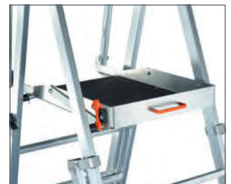
Großzügige, stabile Plattform.