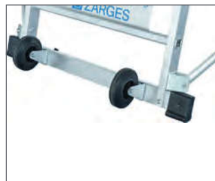
Integrierte Rollen erleichtern das Verfahren.