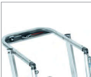
Großzügige, stabile Ablageschale